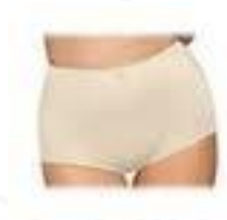
Pantaleta para dama 100% algodón color blanco