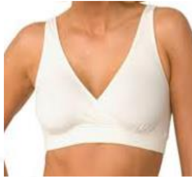
Brasier 100% algodón color blanco sin varillas

REGLON 5 BRASIER 100% ALODON COLOR BLANCO Clave 909-200-0013 CANTIDAD 150