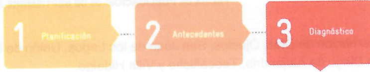
Figura 1. Esquema de las 10 etapas para el desarrollo de Programas Municipales de Cambio Climático en el estado de Jalisco