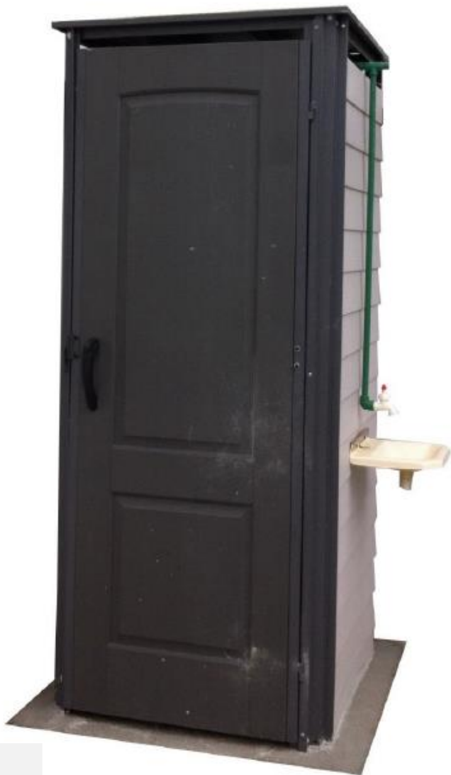
Caseta con WC